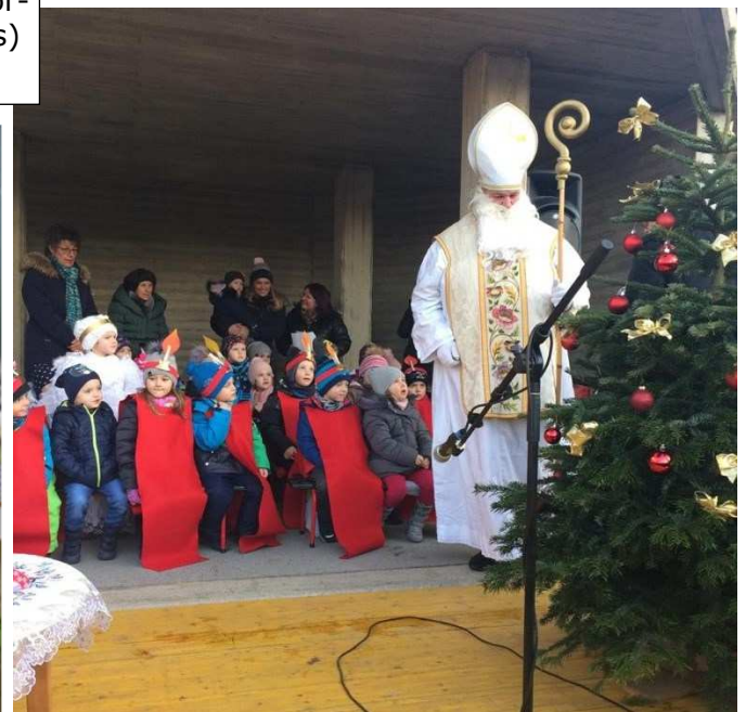
Der Nikolaus besuchte die Kindergartenkinder beim Advent im Dorf.