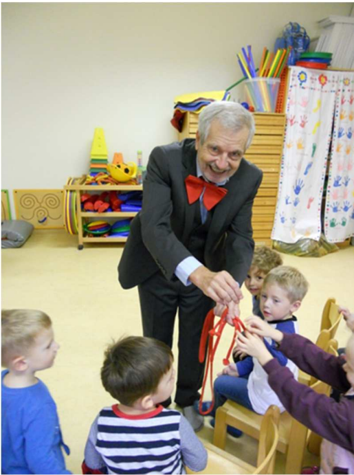
Der Zauberer mit der roten Masche besuchte die Kinder im Kindergarten. (oben)