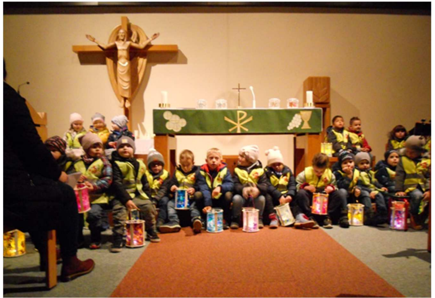
Wir feierten unser alljährliches Laternenfest im Kindergarten.