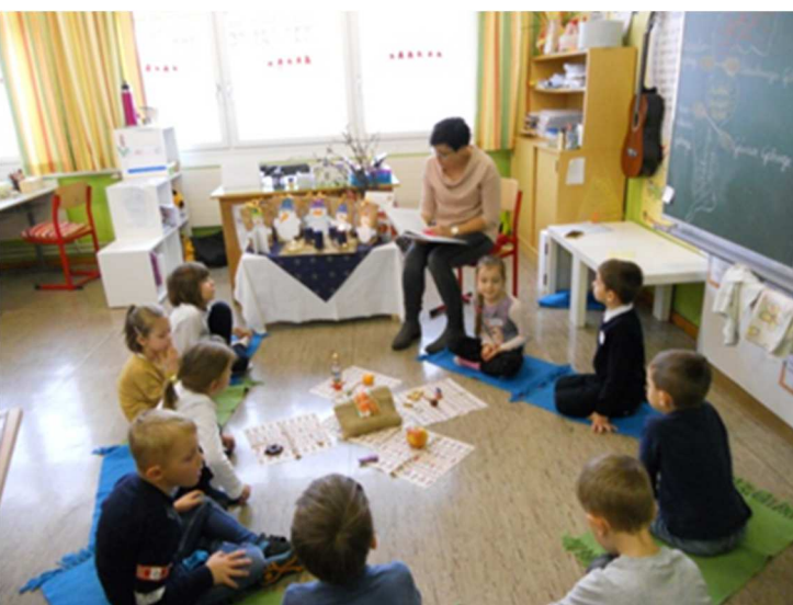
Die Vorschulkinder des Kindergartens verbrachten einen Schnuppertag in der Volksschule Kohfidisch.