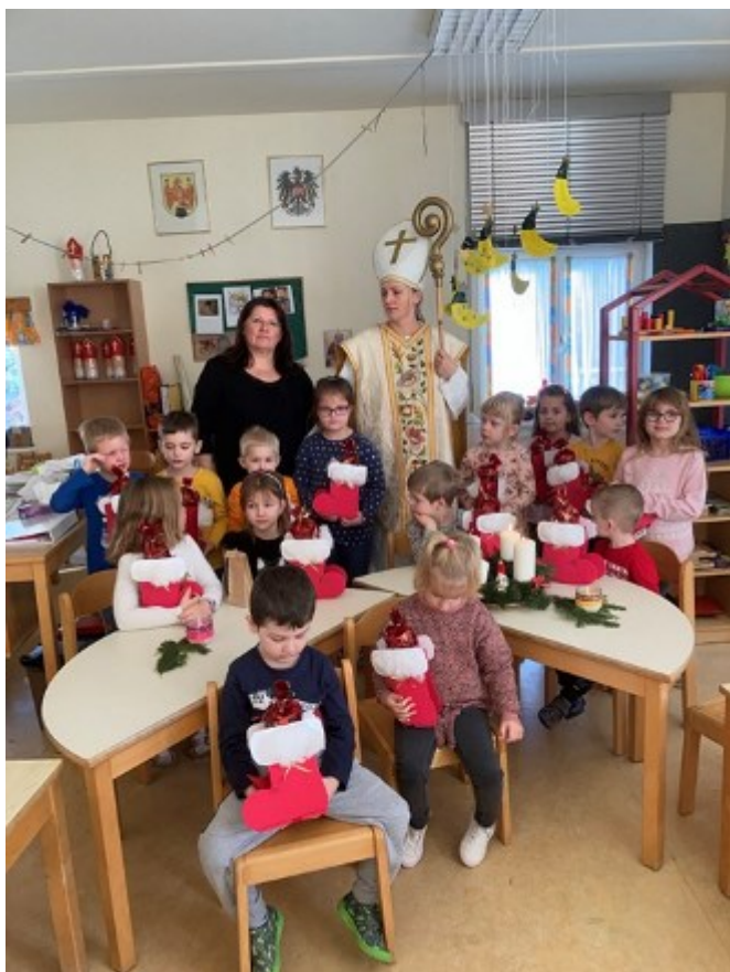
Der Nikolaus besuchte die Kinder im Kindergarten und brachte ihnen kleine Geschenke mit.