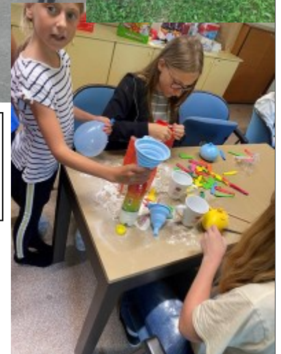
Begeisterung und Spaß bei den Aktivitäten in der Ferienbetreuung.