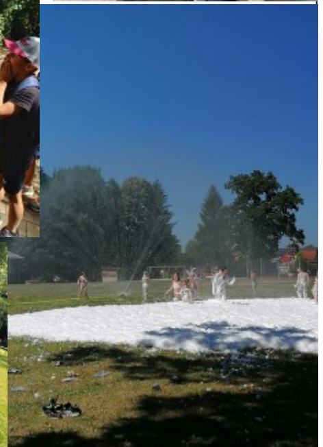
Spaß bei der Schaumparty beim Besuch der FF-Kohfidisch.