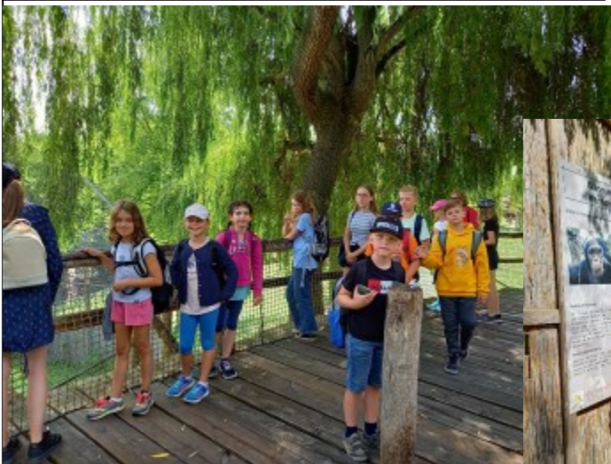
Es wurden Ausflüge in den Tierpark Herberstein und in den Gaudipark nach Zahling unternommen.