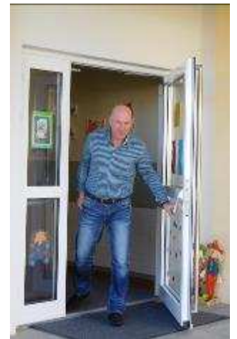
Neues Eingangsportal der Volksschule