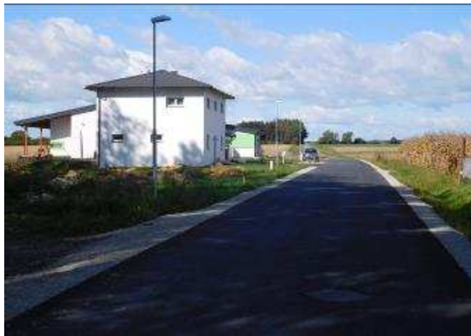
Gemeindestraße Friedhofweg wurde asphaltiert